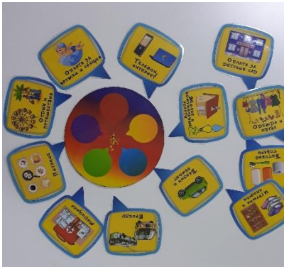
ИГРА «БЮДЖЕТ СЕМЬИ»